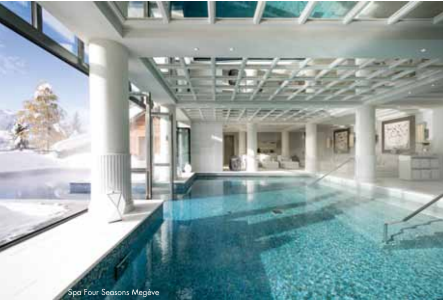
Spa Four Seasons Megève

إذا كنت تبحثين عن إقامة فاخرة للغاية بنمط عصريّ وذي طابع فنيّ وحديث في جبال الألب الفرنسية، توجّهي إلى Four Seasons Hotel Megève. الوجهة الأحدث للفندق في تلك المنطقة الساحرة، إذ افتتح هذا الفندق أبوابه في أواخر شهر ديسمبر في العام 2017. ويضمّ 55 غرفة من ضمنها 14 جناحاً ومطاعم تقدّم قائمة أطعمة عالميةٍ اختيرت لتناسب جميع الأذواق. ويقع مباشرة على منحدرات جبل Mont d'Arbois، ما يجعله الوحيد في المنطقة الذي يطلّ مباشرة على منحدرات التزلج التي ستوصلك إليها عربة الخيل التابعة للفندق، وهي بمثابة Uber في مدينة Megève.