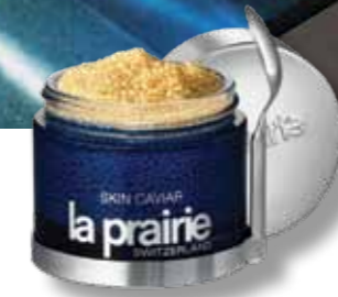
La Prairie Skin Caviar