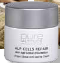
Pure Altitude Alp-Cells Repair Anti-Age Global d'Exception

تشطت الدوران في الأوعية الدقيقة في البشرة وجميع عضلات الوجه وإلى تحسن التصريف للمفاوي الوجهي الذي يعمل على إزالة السموم والتقليل من تراكم السوائل. ثم يُستخدم قناع Alp-Cells Repair بالذهب الذي حالماً يُطبَّق، تمتصه البشرة بسرعة ويزيد من مرونة الجلد. وتتوافر في المركز الصحيّ علاجات بشرة مخصصة لنوع بشرتك وحالتها. أما أنا فبعد قضاء ساعات طويلة للتزجج، أصبحت بشرتي جافة قليلاً لذا طبقت علاج Soins de l'Air Pur لمدة ثمانين دقيقة. وبدأ العلاج أولاً عن طريق إزالة الأوساخ العالقة من البشرة وتطهيرها من الرؤوس السوداء ثم ترطيبها وتدليكها بلطف باستخدام حجر كريم. ثم استخدمت جهاز متطور يريح رأسه البارد على كل الوجه، إذ يوفر لمسات باردة جداً ومفيدة لتعزيز إشراق البشرة وشدها وتقليص المسام. واختتمت الجلسة باستخدام ماسك وكريم العينين. أما النتيجة فرائعة للغاية وشعرت بالفائدة وبدت بشرتي صافية. سبا Pure Altitude في Les Fermes de Marie يحمل في داخله جوهر الفلسفة التي وضعتها العلامة التجارية. فتجمع طقوس العلاج بين الإيماءات اللطيفة والمكونات الفعالة للحصول على نتائج مضمونة.