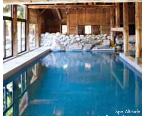
Spa Altitude Les Fermes de Marie